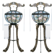
「やよいとう」 弥生灯 〔高さ108cm〕