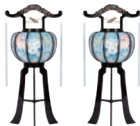
「まつかぜとう」 松風灯 〔高さ68cm〕